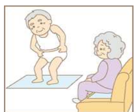
※ベッドに敷く他に、よく座 る場所・着替えの際にもお 使いいただけます。