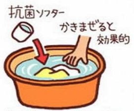
すすぎが終了後に入れる。