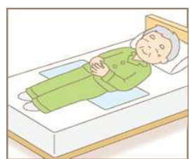
お尻の辺りをカバーで できるよう、布団やベッド に横向きに敷く。